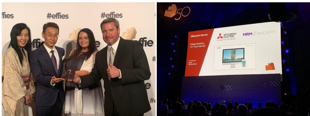
Effie Awards-Verleihung (30. Mai 2019, Ortszeit: In New York • Effie US GALA)

TOKIO, 3. Juni 2019 – Mitsubishi Electric Corporation (TOKIO: 6503) gab heute bekannt, dass die Building Solutions-Website von Mitsubishi Electric US, Inc. in der Business-to-Business-Kategorie (BtoB) der Effie Awards eine Bronze-Auszeichnung erhalten hat. Bei den Effie Awards handelt es sich um ein internationales Auszeichnungsprogramm, durch das hervorragende Leistungen in der Werbung anerkannt werden. Mitsubishi Electric ist dieses Jahr der einzige Gewinner in der Kategorie BtoB, und es ist vermutlich das erste Mal, dass ein japanischer Elektronikhersteller einen Effie Award in dieser Kategorie erhalten hat.